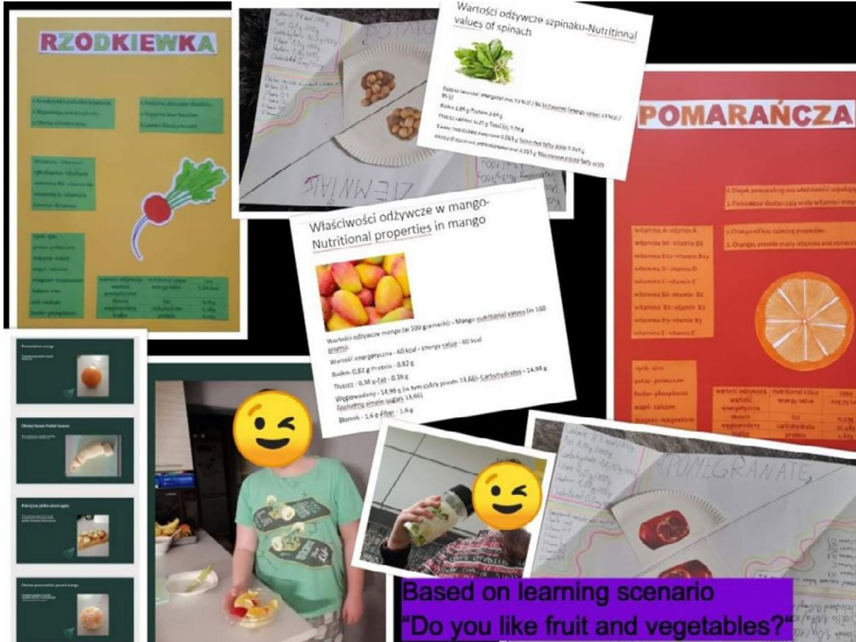
Bild von Gemüse und Obst sowie Salaten und Cocktails erstellen.