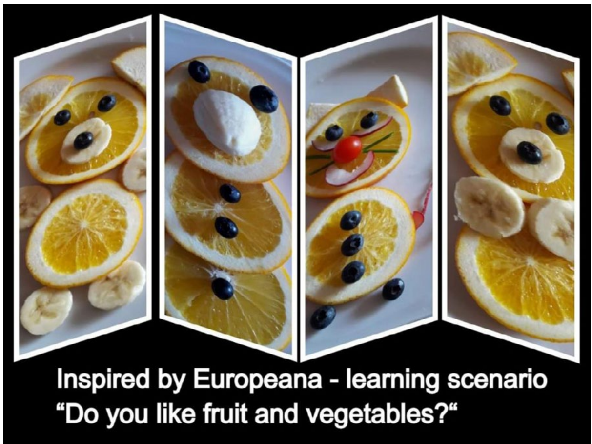
Inspired by Europeana - learning scenario "Do you like fruit and vegetables?"

Ergebnisse der kreativen Beschäftigung meiner Schüler/innen mit Obst und Gemüse